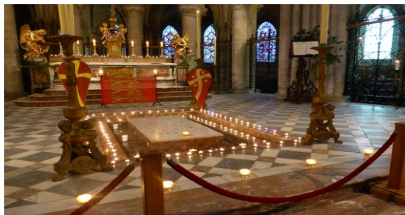
Grabmal von Wilhelm dem Eroberer