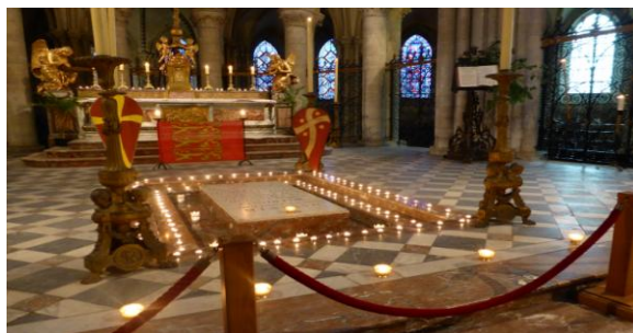
Tombeau de Guillaume le Conquérant